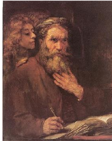
'De evangelist Matteüs en de engel' Rembrandt van Rijn